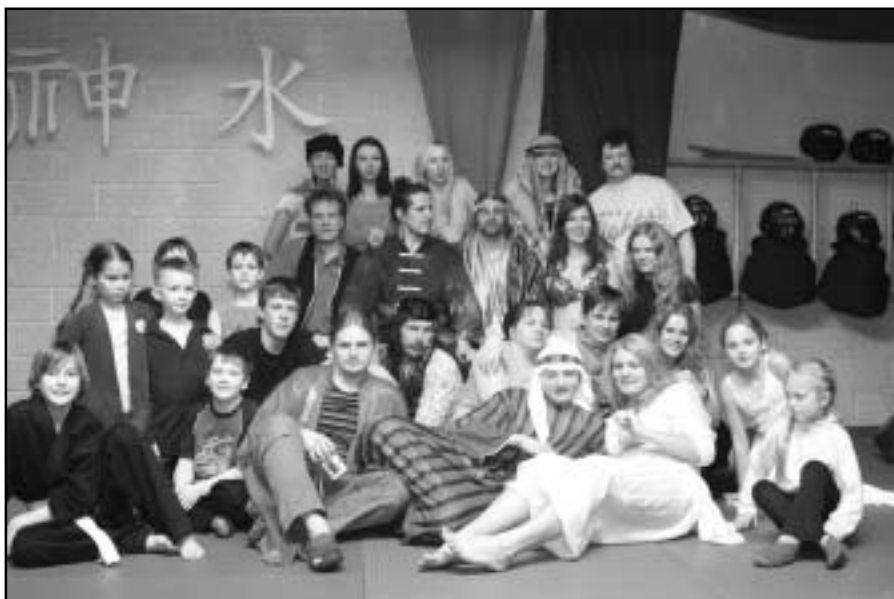
Lielvārdes pašaisardzības skolas „Dao dugu shen” audzēkņi svinot Žurkas gada iestāšanos.