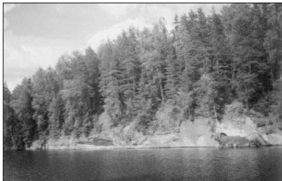
ZA “Brasla” apkārtnē daudzviet redzamas skaitas sarkanās klintis.

Izaudzētās zivis atjauno Latvijas dabas resursus. Mēs zinām, ja nestrādātu zivjaudzētavas, tad daudzām zivju sugām draudētu iznīkšana. Mūsu zvejnieki var strādāt tikai tāpēc, ka mēs strādājam.