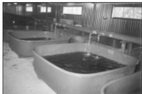
Vannas zivju mazuļu audzēšanai.

Mēs tikai šogad to uzsākām, iekļāvāmies divos maršrutos- “Viena diena Vidzemē” (ar šo maršrutu varējāt iepazīties KPV Nr.202) un otrceļojums Straupes pagastā, kurā iekļauti Pazemes ezeri, Straupes pils un baznīca, mūsu zivjaudzētava. Šo maršrutu izstrādāja vietējā pašvaldība kopā ar vietējiem uzņēmējiem.