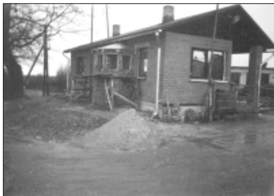
CBF SIA “GRANTE” ofisa ēka pašlaik tiek labiekārtota.

Incimā pie mehāniskajām darbnīcām, kuras tagad pieder SIA “GRANTE”, notika intensīvi rakšanas darbi. Izrādās, tika taisīts ūdensvads, jo kolhoza laikā esošo