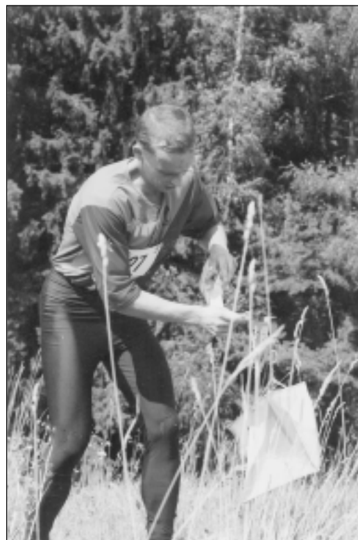
Tā izskatās orientēšanās sacensību kontrolpunkts, kurš sportistam jāatrod pēc kartes, tad kontrolkartiņā jāatzīmējas ar tur izvietotu kompostieri. Austrijā sacensībās atzīmēšanās notiek elektroniski – caur satelītu.