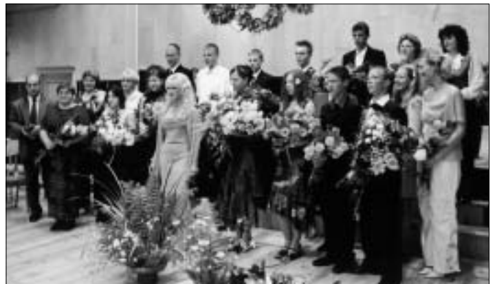
Ši gada 9. klases izlaidums.

Kā balvu par aktīvu piedalīšanos sportā un mākslinieciskajā pašdarbībā esam iecerējuši šiem bērniem rīkot vasaras nometni "Ak-